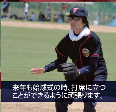
来年も始球式の時、打席に立つ ことができるように頑張ります。