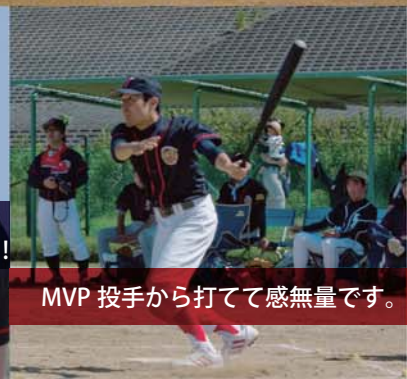
MVP 投手から打てて感無量です。