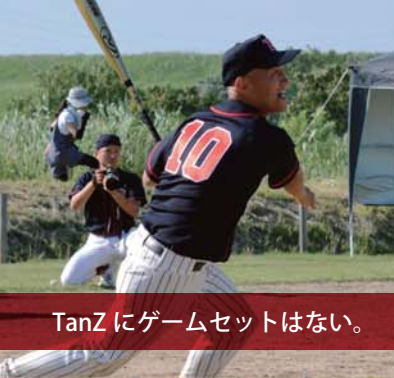
TanZにゲームセットはない。