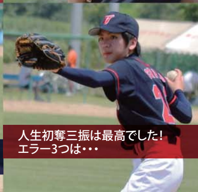
人生初奪三振は最高でした！ エラー3つは...