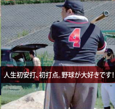
人生初安打、初打点。野球が大好きです！