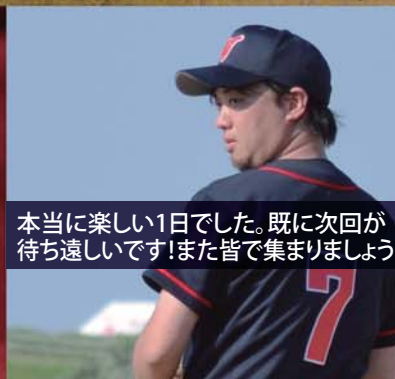
本当に楽しい1日でした。既に次回が 待ち遠しいです！また皆で集まりましょう！