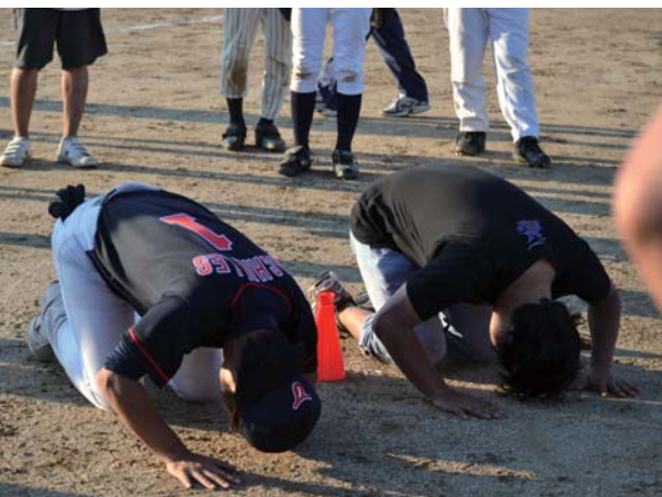
2人の土下座シーンが見られるのはTanZ総会だけ!