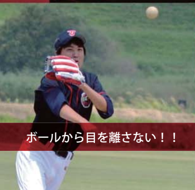
ボールから目を離さない！！