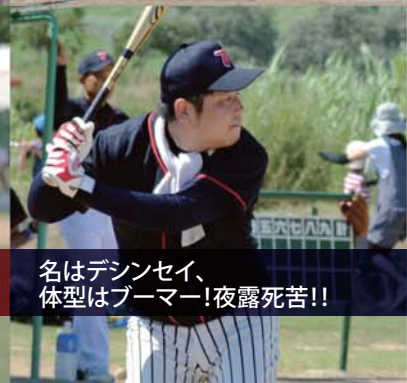
名はデシンセイ、 体型はブーマー！夜露死苦！！