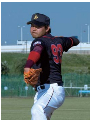
山形のサミーは前評判通り投打に大活躍。

しかし、両チームとも四球と不運なエラーが重なり、ビッグイニングが生まれやすくなっていた。特にレフトの頭上を越えると、となりのグラウンドまでボールが転がってしまい、ランニングホームランが出やすいのがその一因。そこに気がついたEAST監督の6番ライト・ビッグマグナムは、守備に定評があるミドサー道産子をレフトに移動。ミドサーはレフト初体験だったが、安定感のある守備でチームの危機を救い、中盤はEASTが優勢に試合を進める。