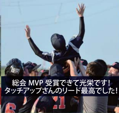
総会 MVP 受賞できて光栄です！ タッチアップさんのリード最高でした！